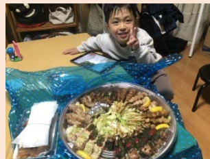
福山で焼き鳥といえばこ！ かんべ▼福山市能島3-7-9

コロナウイルスの影響で軒並み飲食店は厳しさが増えています。少しでもお力になればと思い、当事務所でもお客さまのお弁当等をテイクアウトでいただきました。皆さんもご最良のお店があったら、テイクアウトで応援しましょう。