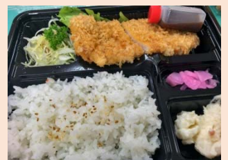
お弁当500円唐揚げが美味しい 登奈利▼井原市井原町313-2