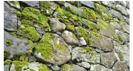
●若者に人気のパワースポット。真ん中にハートの石、その横に亀の形の石が