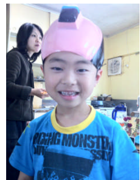
●ユーモアたっぷり、絵が得意な次男坊。後にいるのは奥さん

これからも皆さんに楽しく読んでいただけるニュースレターを目指して 毎号、作っていきたいと思いますので、よろしく願いいたします。( _ _ )