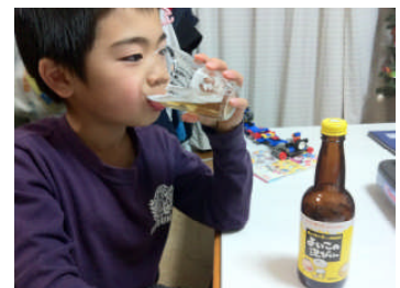
●ポーズを要求すると必ず応えてくれるサービス精神旺盛な長男↑

最近、3 年生になった長男坊が友だちと遊ぶようになり、だんだんと家族全員で出かけることが少なくなっているような気がして、ちょっと寂しい気がしています。(涙)