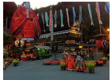
●派手な外観で有名な「山賊」

帰ってから、未だに「山賊焼き食べたい〜」と口にすると 「パパまだ言っとる」と子供たちから突っ込まれています。 だって食べたかったんだもお〜ん (-“-) (文・妹尾 悟)