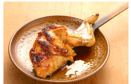
●こちらが一番人気の山賊焼きです。