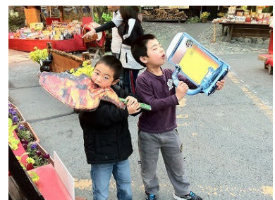
●こんなふうにかぶりつきたかった…