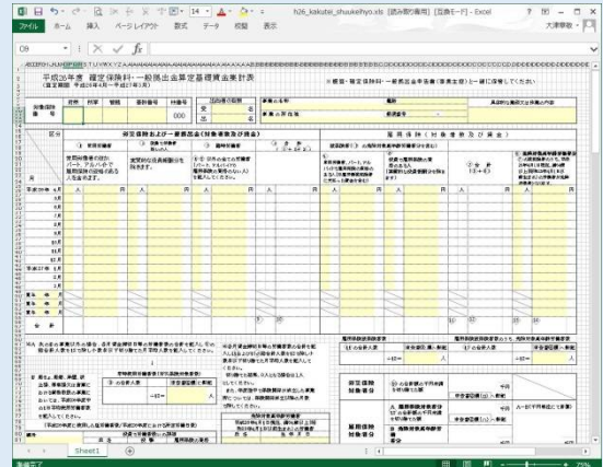
●厚生労働省のホームページで公開されている年度更新プログラムの1つ。継続事業で賃金を集計するときに便利。

申告する際に保険料の根拠となる賃金を集計するエクセル(Excel)で作成されたプログラムが、今年も厚生労働省のホームページから配布されていますので、自社で申告をされる方は、ぜひ利用してみてください。