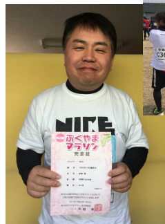
●なんとか無事完走することができました