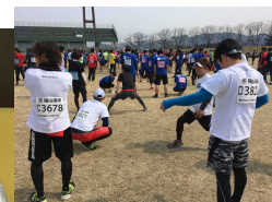
●スタート前。緊張感漂うとき