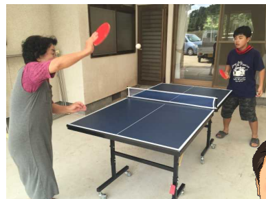
●ばあちゃんは元卓球部。いぶし銀のラケットさばき。

卓球は、見るよりするほうが面白いですね。子ども相手に本気になります。といっても子どもたちのほうが上手ですが。(汗)