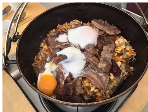
●“手抜き”ビビンバでも、ダッチオーブンで作ると雰囲気がちがいます。