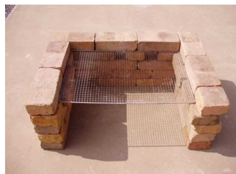
●レンガを積んだだけのバーベキューコンロ