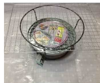
●園芸プランターでできるバーベキューコンロを発見