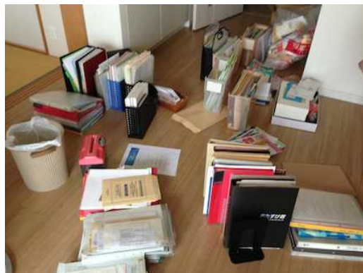
●私の断捨離の対象は、書類が多い

断 入ってくる不要なものを 断つ 捨 不要なものを 捨てる 離 モノの執着から 離れる